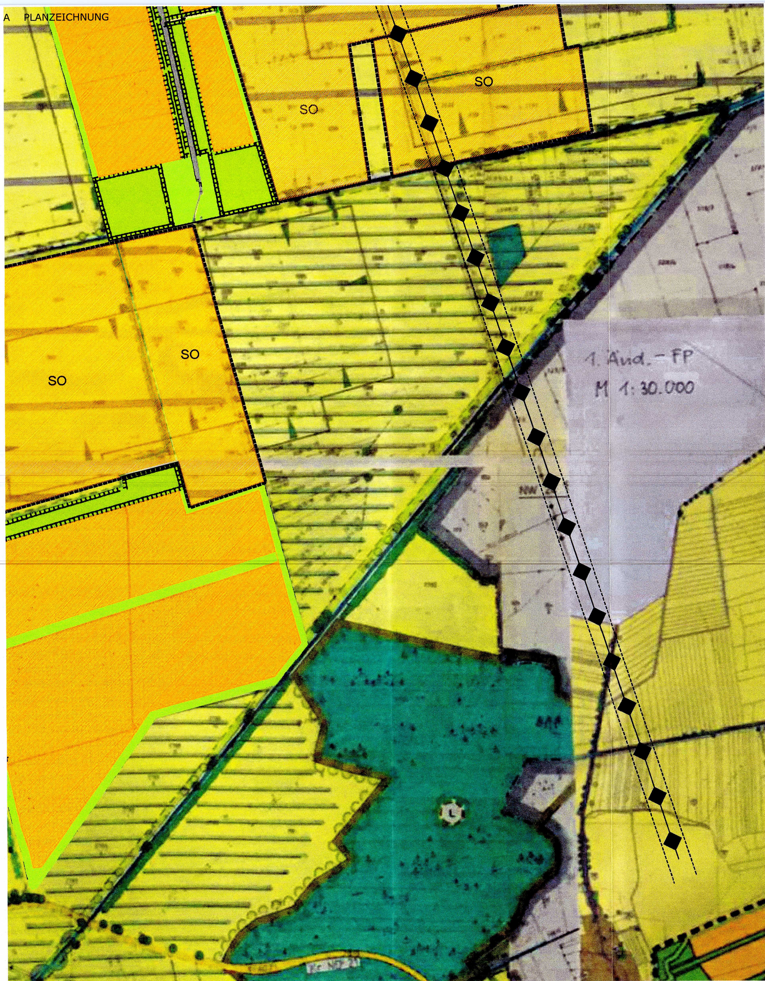
Rechtsgültiger Flächennutzungsplan vor der Änderung